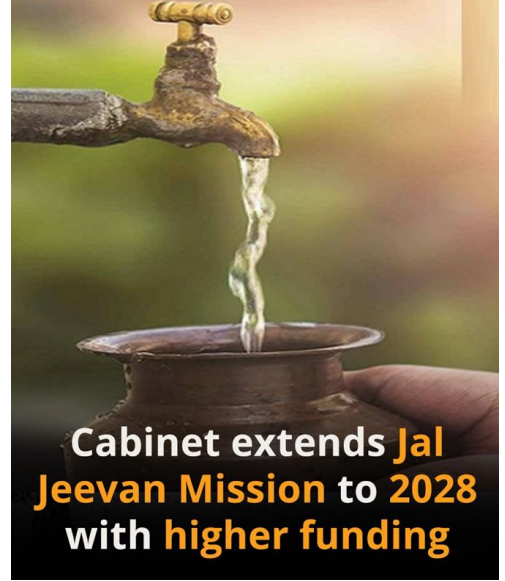
Cabinet extends Jal Jeevan Mission to 2028 with higher funding